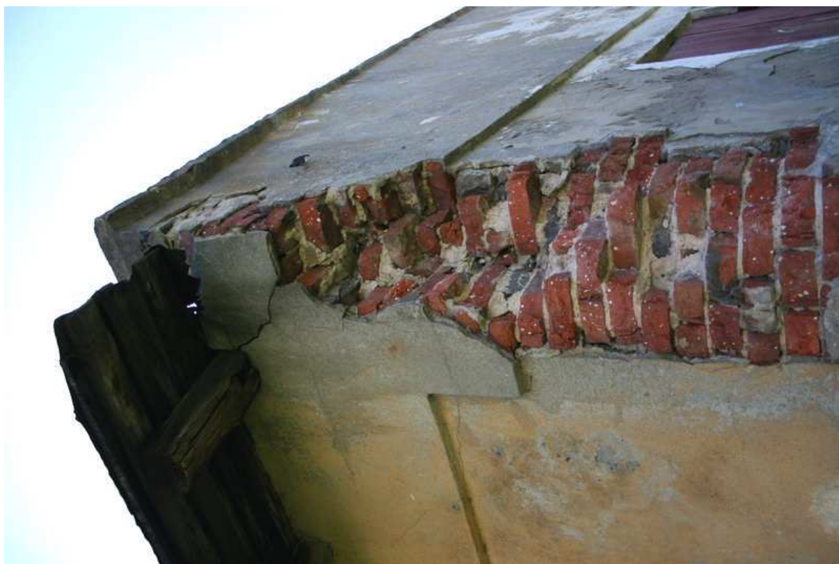
Fot. 4 – Szczegół więźby dachowej oraz narożnik ściany zewnętrznej