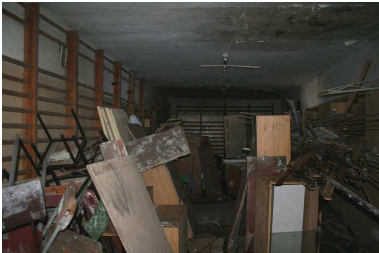
Fot. 3 – Wnętrze budynku