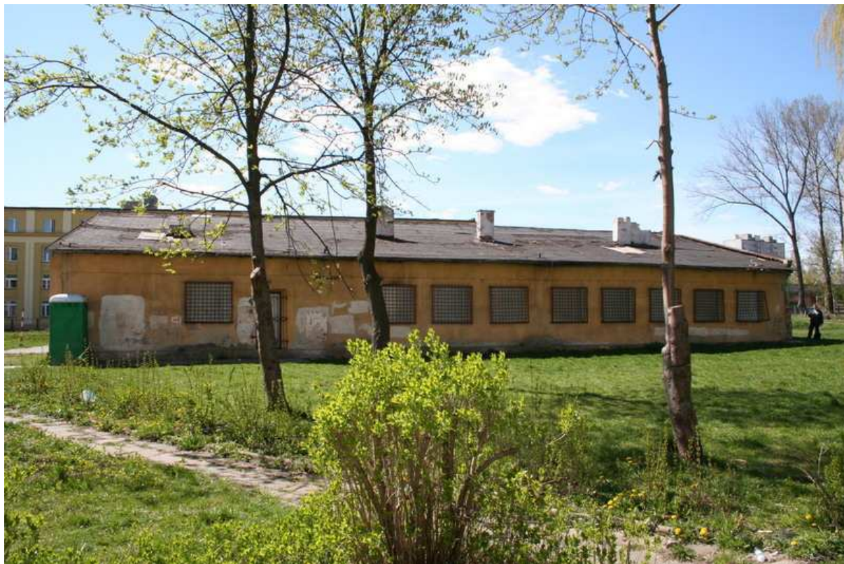
Fot. 1 – Widok budynku od strony ulicy Chałubińskiego