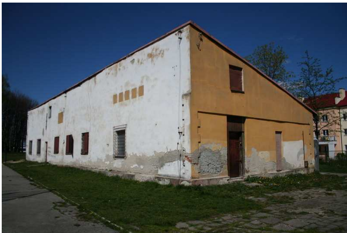
Fot. 2 – Widok budynku od strony południowej